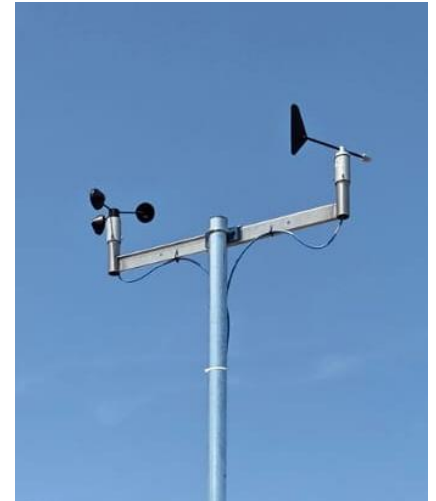
Tipica installazione per applicazioni meteorologiche e di monitoraggio ambientale